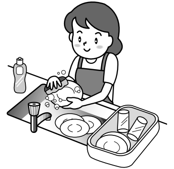
石狩市と厚田村の下水道料金の比較 (税込)

石狩市と厚田村で下水道事業を行っています。同じ下水道事業ですが、石狩市は市街地で開催される公共下水道なのに対し、厚田村は、市街化区域以外の水質保全や環境保全を目的とする特定環境保全公共下水道で、その性格が大きく異なっています。独立採算経営を目指すことが可能な石狩市の下水道と、事業の性格から独立採算は困難な厚田村の下水道では、経営状況や料金に大きな格差があるため、経営の健全化や利用者の負担を考え、合併時は2市村の下水道事業及び料金体系をそのままとすることとしました。合併後は事務体制の合理化など、経営の健全化に努めるとともに、会計や料金のあり方について検討を行いません。