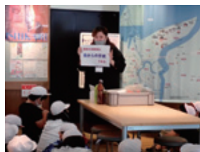
双葉小学校 5年生(6月12日) 石狩浜の漂着物と環境