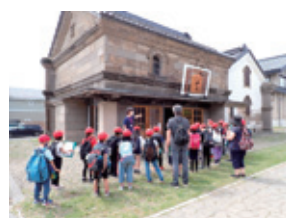
双葉小学校 3年生(6月22日) 資料館・旧長野商店の見学