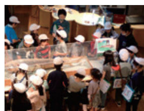
紅南小学校 3年生(6月30日) 資料館・旧長野商店の見学