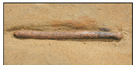
出土した魚たたき棒

エリの構造は、川底に打った支柱に木の枝とブドウツルで編んだ柵を立てかけるもので、近世アイヌのサケ漁施設「テシ」とほぼ同じ物と考えられます。また、遺物のなかには近世アイヌが使用した「魚たたき棒」と類似する木製品もあり、4000年前から近世アイヌ同様のサケ漁が行われていた可能性が高いと考えられます。