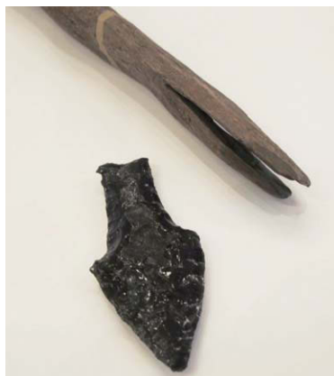
鋳(もり)と先端につける石器