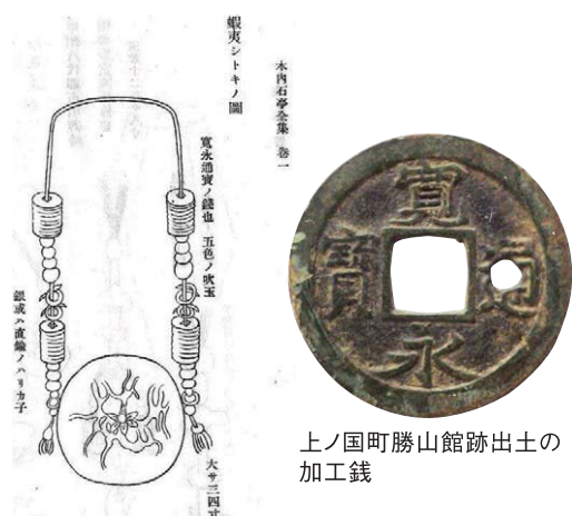
寛永通寶を使ったアイヌの首飾りの例

いうのがあり、一文で小松菜が買えたようです。 加工銭とは意図的に手を加えたものをいいます。小さな穴を開けるのもその一つです。これまで寛永通寶ではわずかに一例しかなく、千歳市のアイヌ文化の遺跡で出土したものが唯一でした。発掘の報告書を中心に探すと道東の別海町の通行屋(旅人のための公的施設)跡でもう一例見つかりました。例は増えましたが、石狩浜の例を加えても寛永通寶の加工銭