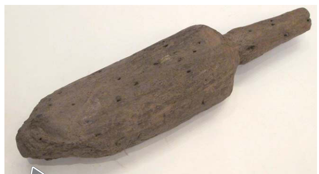
写真① 先端がとがった木槌 長さ44.0cm 幅10.8cm (石狩紅葉山49号遺跡、縄文時代中期末、約4千年前)