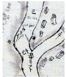
イザリトの上流(現在の恵庭市漁太付近)のウライ。ウライはアイヌの伝統的なサケを捕る仕掛け。当時は各地にウライがあったが、絵図に描かれるのは珍しい