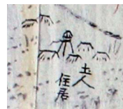
草ぶき風の家の間に高床の建物が描かれている