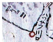
ハッサフ川(発寒川)と石狩川の合流点。家のそばに立つ細い柱状のものは、ほかの場所にも描かれている。漁場の標柱だろうか、それとも一里塚のようなものだろうか