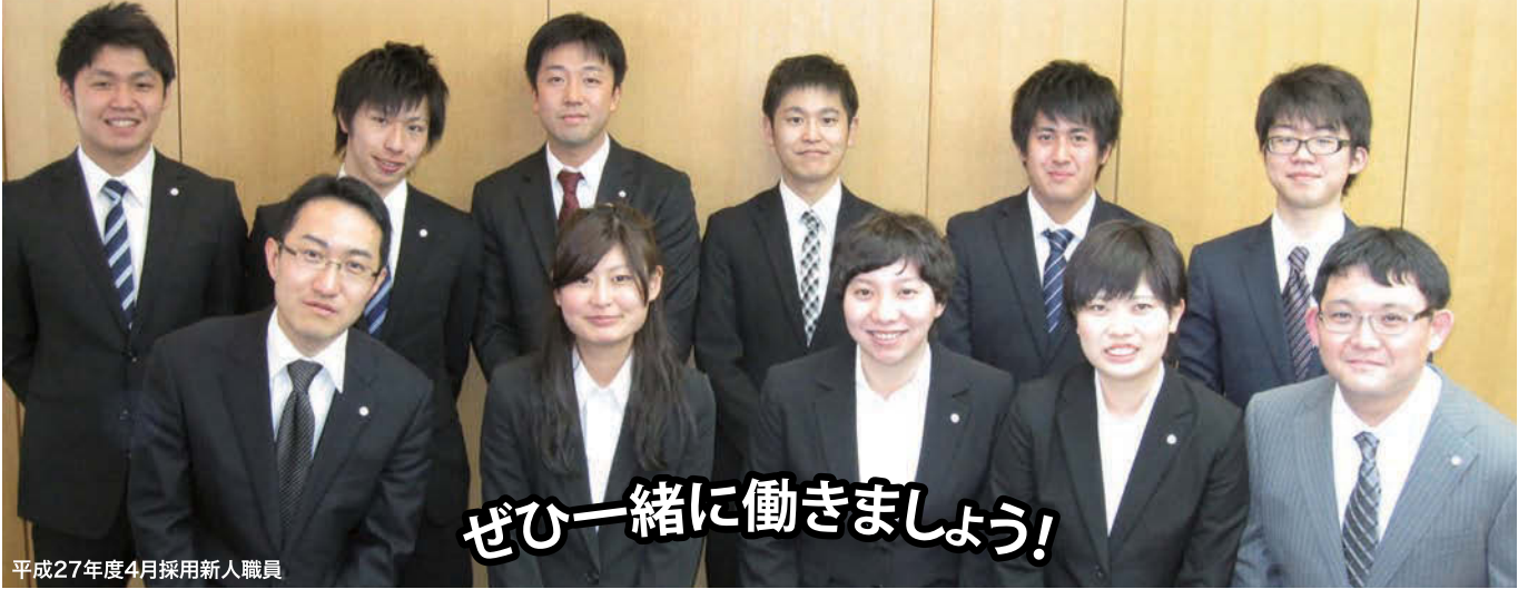
平成27年度4月採用新人職員