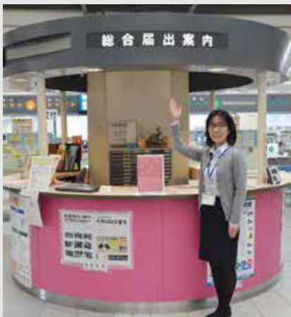
▲市役所1階の総合案内