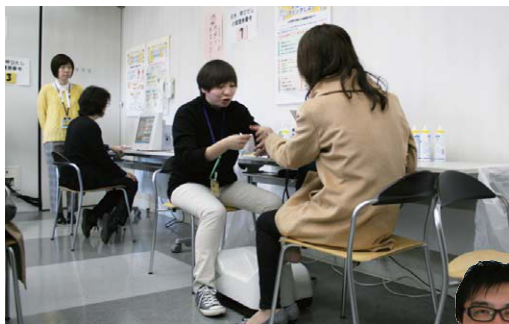
体組成や血圧、血管年齢や脳年齢などをチェックした「健康測定コーナー」。