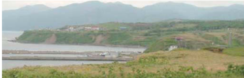
図2:古潭の海岸段丘地形。1段目と2段目が見える