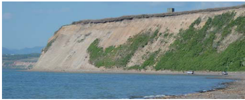
図3:望来海岸の海食崖