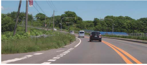
図1:聚富の坂道(国道231号)