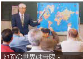
地図の世界は無敵大