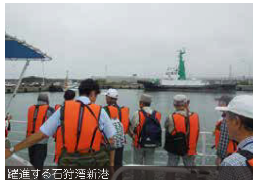
躍進する石狩湾新港