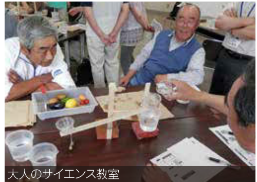
大人のサイエンス教室