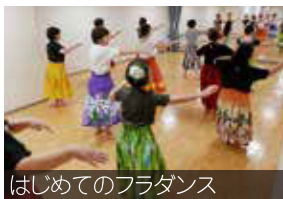
はじめてのフラダンス

皆さんにマジックを楽しんでもらう機会があればと思っていたところ、たまたま市民カレッジの「まちの先生企画講座」の募集チラシを拝見し、これだ!と思って昨年初めて「だれにでもできるマジック」講座を開きました。実際にやってみたら、受講者の皆さんの反応がすごくよくて、教える私もとても楽しかったです。