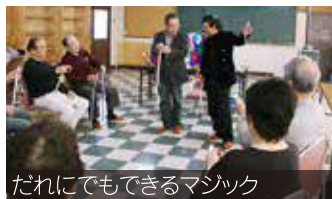
だれにでもできるマジック