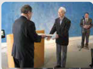
学びのスタンプの数に応じて学長(市長)から修了証が手渡されます!