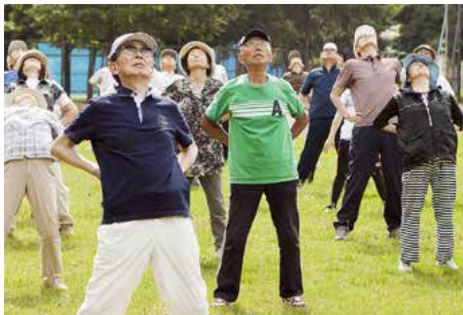
ラジオ体操大会：年に1回、わかば公園で6町内会が合同でラジオ体操を行います。