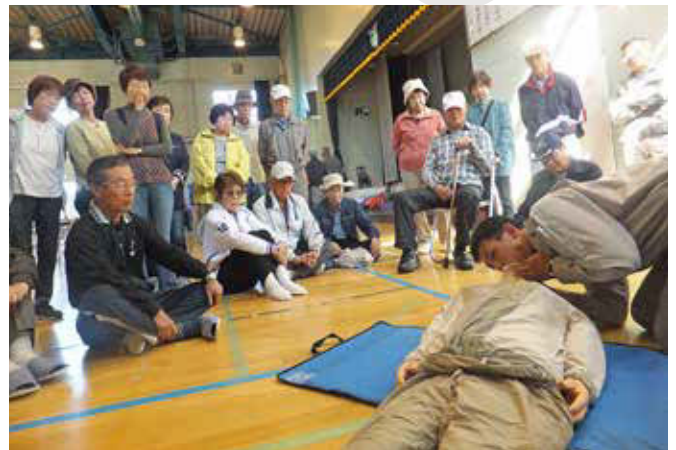
合同避難訓練：6町内会が合同で心肺蘇生法や災害時の初期対応について受講。