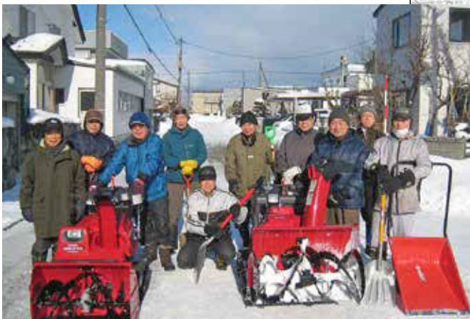
歩道除雪事業：幹線道路への通り抜け歩行線や未除雪歩道の除雪を行います。

花川北地区では65歳以上の方が約4割を占め、市全体の約3割に比べ、高齢化率がやや高い傾向にあります。