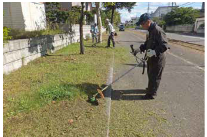
草刈り事業：小公園・歩行線などの草刈りを実施します。