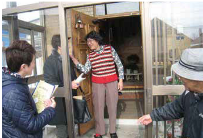
声かけ安否確認活動：高齢者宅を訪問し、見守りの声かけ運動を行います。

3年目を迎えるにあたり、役員同士はもちろんのこと、地域住民にも「わかば地区地域会議」への理解が深まり、活動の定着を感じるようになりました。そんな中、新たに買い物通院送迎支援事業や、公園に高齢者サロンを設けたいという企画も生まれており、より一層地域住民のニーズに応えた事業を展開したいと思つているところです。