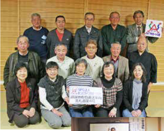
月1回行うサポーターたちの会合で