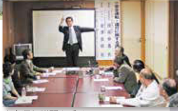
安全運転講習を受けるサポーターたち

NPO法人 あつたライフサポートの会 ☎080・4505・7707 ※平日9時～16時 厚田区民を対象とするこちらのサービスを利用するには会員登録(年会費1,000円)が必要です。 ほかにも除雪事業など、詳しくはお問い合わせください。