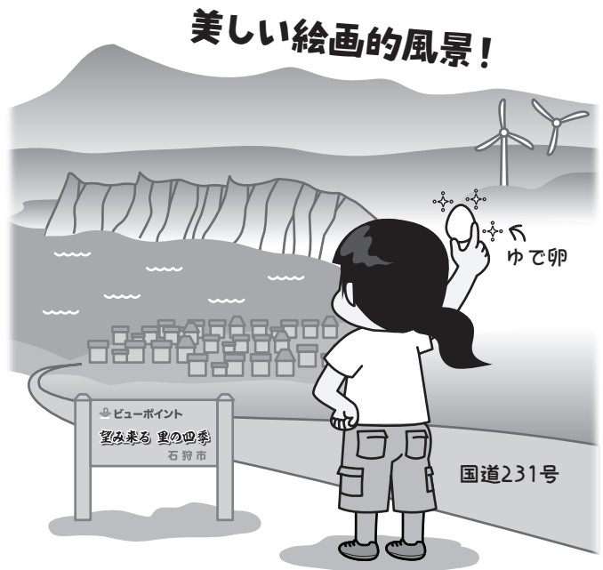
所 望来の坂(厚田区望来) 飛ぶ鳥農場(厚田区望来299・9) 厚田港朝市(厚田区厚田7・4)

まず、道の駅石狩「あいーど厚田」に行き、売店で宮崎商店さんの「厚田もなか(シャコ)」を購入しましょう。このとき、レジで元気ハツラツな秋井卓也社長に出会えたらラッキーです! ぜひ話しかけましょう♪