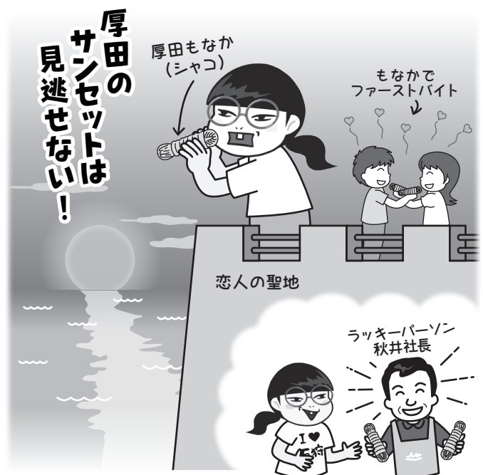
所 道の駅石狩「あいーど厚田」(厚田区厚田98・2) 恋人の聖地/厚田展望台(厚田区厚田)