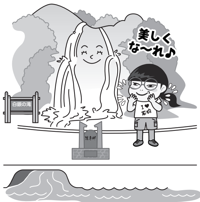
所 白銀の滝(浜益区雄冬) 浜益ふるさと公園ラバース・オーシャン(浜益区浜益77・3)

夏、疲れ切った体へ一気にパワーチャージをするなら、問答無用で 白銀の滝 が最適でしょう。国道231号沿いにある“天然クーラー”への道はドライブコースとしても最高で、お天気の良い日には、きれいな海岸線を眺めるだけで運気が上昇しそうです。