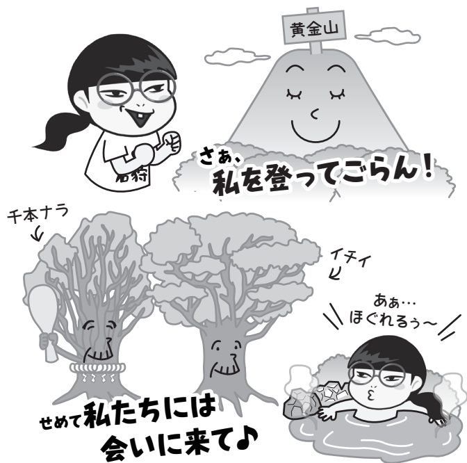
所 黄金山(浜益区実田) 浜益温泉(浜益区実田254・4)