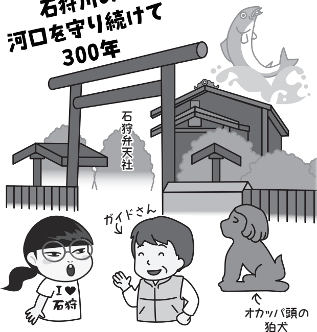
所 石狩弁天社(弁天町18) 石狩市観光センター「ゆめぼーと」(親船町107)

今年、130歳になったばかりの石狩灯台。赤と白のしま模様に包まれたその姿は、市民の方なら誰もが知っていると思いますが、実際その目でご覧になった方は、どれくらいいるのでしょうか?