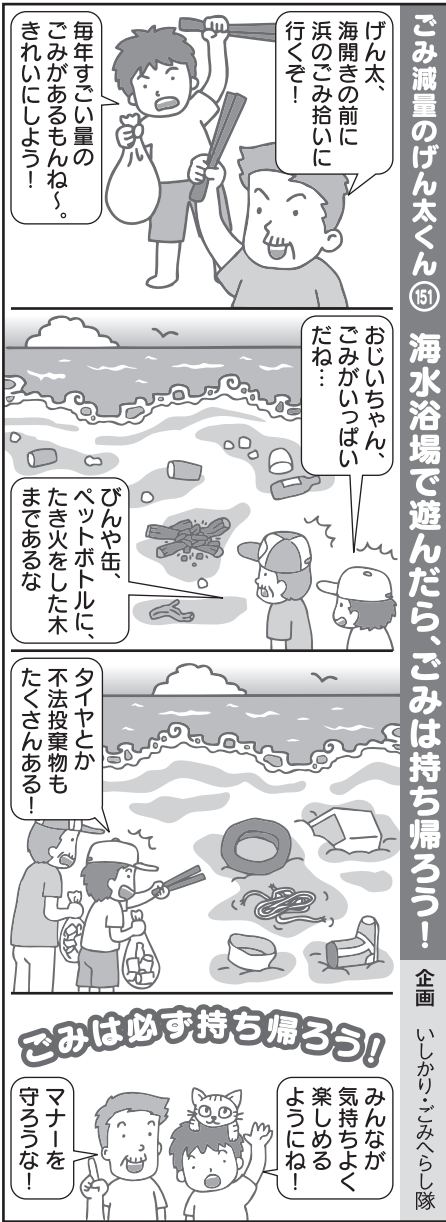
企画 いしかりこみへらし隊