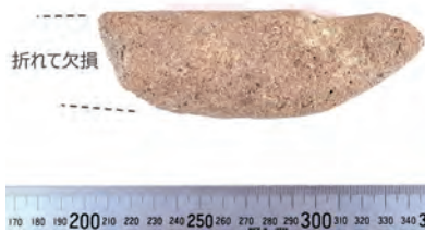
写真3 魚形石器／紅葉山33号遺跡

しました。発掘当時の所見によると、北海道東部の統縄文文化の遺跡で出土した石製の「環」に類似すると指摘されています。 紅葉山33号遺跡から出土した他の墓の副葬品全体をみても、北海道の北方と南方の中間的な要素がみられます。「漆塗り弓」に描かれた渦巻文様も、両文化圏との関わりとともに、そのルーツがどこにあり、その後どうつながっていくのかを探る必要があります。 9月16日(土)～11月19日(日)まで、国立アイヌ民族博物館(白老町)で開催される特別展「考古学と歴史学からみるアイヌ史展―19世紀までの軌跡―」に、紅葉山33号遺跡の「漆塗り弓」が展示されます。ぜひご覧ください。 (荒山千恵)