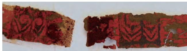
写真2 「漆塗り弓」に描かれた渦巻文様／紅葉山33号遺跡