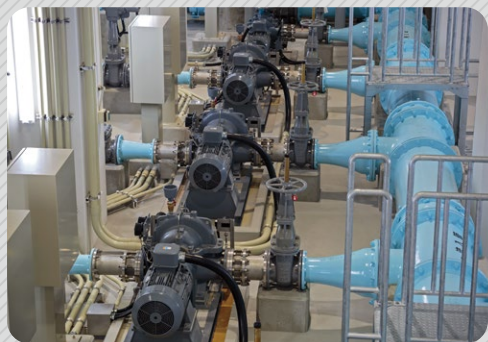
▲新港中央配水場のポンプ

各家庭に水を送るには、高台から高低差を利用して配水する方法と、ポンプを使って圧力をかけて配水する方法があります。旧石狩市域は平地のため、ポンプで圧力をかけて各家庭に水を送っており、動力費(電気)が必要です。