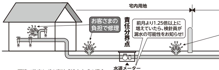
▲一戸建て住宅などの直結式給水方式の場合 給水管と、これに直結するバルブ類、蛇口などの給水用具を「給水装置」といいます。給水装置は劣化するものであり、特に地面の下の給水管は気が付かないことも。水道メーターなどで定期的に確認を!

なお、配水管が原因の漏水もありますので、道路に水が流れたり噴き出しているのを発見したら、水道施設課までご連絡をお願いします。