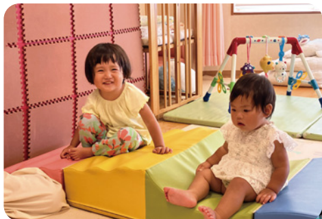
取材当日、遊びに来ていたお友達♪