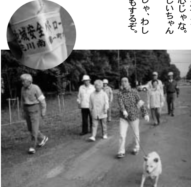
▲花川南第1町内会のパトロール風景

活動は6月から始まっています。その特徴は、コースもペースも自由で、無理がないこと。犬の散歩を兼