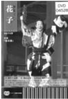
発売元/森崎事務所

●開館時間 火・金10:00~18:00 水・木10:00~20:00 土日祝10:00~17:00 分館(花川北・花川南・八幡)10:00~17:00