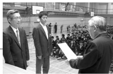
樽川中学校で行われた学校版環境ISO認定証授与式。

●広報紙への感想や批評、市への質問など何でもお寄せください。 ※匿名希望の場合もお便りには名前・住所・電話番号を必ず明記してください。 〒061-3292 石狩市役所 広報 いしかり 係 ☎72-3153 ☎74-5581 ✉PR@city.ishikari.hokkaido.jp