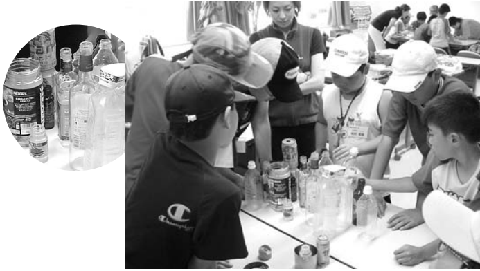
ごみ分別体験の様子