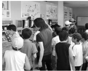
「北石狩衛生センター」の コントロールルーム