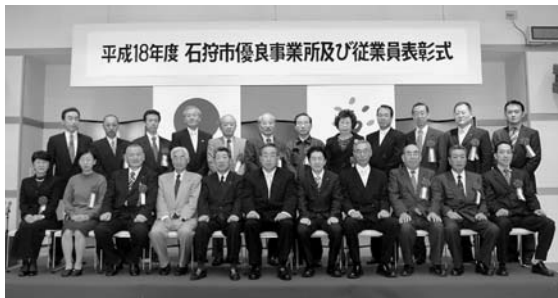
平成18年度 石狩市優良事業所及び従業員表彰式

11月10日(金)りんくるにて、事業所11社、従業員4人の方々が表彰されました。受賞対象は、市内に所在する優良な商工業の事業所および市内事業所に永年勤務する模範的な従業員の方々です。