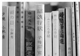
2階の地域資料(石狩)の棚で。一見、任侠物とも思わせる背表紙。