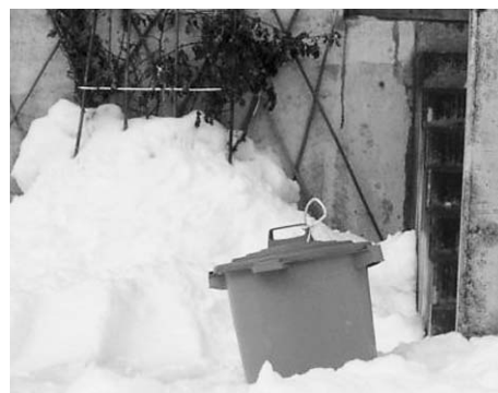
ポリバケツタイプ