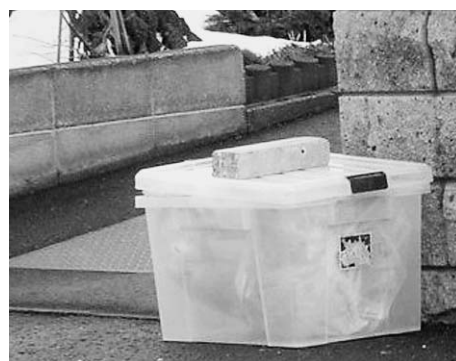
衣装ケースタイプ

出したごみがカラスやネコなどに荒らされな いよう、また、風で飛ばされないよう工夫し、 隣近所の迷惑にならないようお願いします。