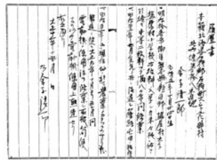
金子家文書 北越時代から石狩入植後の花畔村開拓の過程が記録された1,600点に及ぶ文書群。平成11年に石狩市指定文化財第5号に指定された10点は図書館で複写物を所蔵しています。

治8年河内小学校・塩屋小学校創立」とあったので、現住所確認のため電話帳をめくると、残念ながら載っていませんでした。どうやら廃校になったようです。