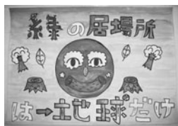
【市長賞】〈高学年の部〉