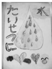
【市長賞】〈低学年の部〉

9月4日(月)～15日(金) 花川南一条郵便局 9月19日(火)～29日(金) 市役所1階ロビー