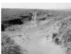
図2:植物がなくなって削られた砂丘