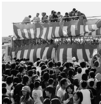
フィナーレで行われたくじ付きもちまき