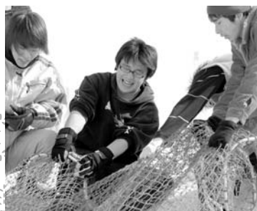
昨年の「鮭の地引網レース」の様子

日 2月17日(土) 12:00~19:00 時 2月18日(日) 9:00~15:00 場所 市役所正面向かい特設会場