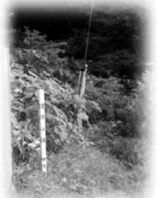
濃昼側山道入り口