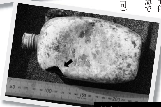
被害者B: 日本製プラスチック容器

■文化財課・いしかり砂丘の風資料館 ☎62-3711 ✉bunkazaih@city.ishikari.hokkaido.jp