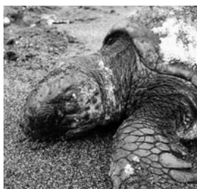
容疑者A: アカウミガメ