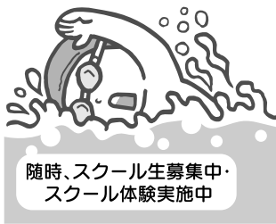
随時、スクール生募集中・スクール体験実施中