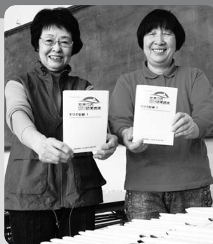
学びの記録手帳も市民の手作り