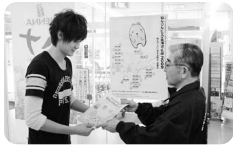
店内に大会ポスターを貼らせてもらいながら大会を宣伝。地域推進員の皆さんの地道なPR活動はこれからも続きます。

地域からの推薦を受けて、ねんりんピック北海道・札幌2009実行委員会が委嘱している地域推進員は、まさに大会PR活動における「地域のリーダー」。全道では95人が選ばれ、そのうち石狩市では5人の方が、昨年10月に委嘱されました。地域推進員に求められるのは、自主的なPR活動です。例えば地域推進員が所属する団体や、日常の地域活動、趣味などのサークルにおいてPR活動をしたり、地域の中で大会への協力を呼びかけながら、ポスターを貼ったり、リーフレットや啓発グッズを配布するなど、PRが可能な場所の確保に努めます。