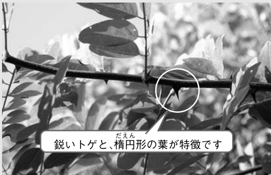
だえん 鋭いトゲと、楕円形の葉が特徴です

市では、道路や公園の樹木の適正な管理に努めていますが、ニセアカシアなど繁殖力が強い木では、せん定が追いつかない状況もあります。十分ご注意ください。