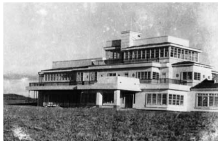
■海浜ホテル ※昭和20年空襲により消失