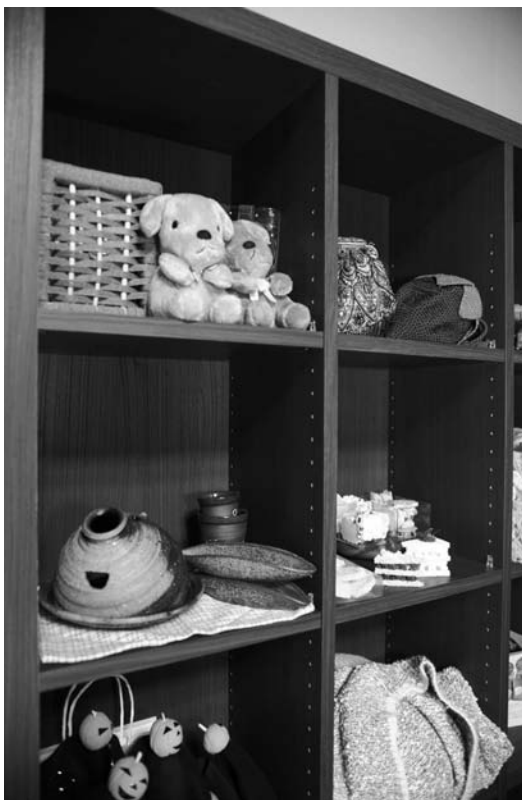
これは「レンタルBOX」。この棚で手作りのビーズアクセサリやあみぐるみなどのミニショップを始めてみませんか! (有料)