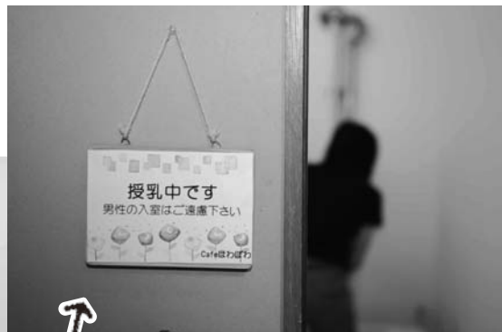
「おもちゃの部屋」は親子で一緒に遊べる空間。ここは授乳室にも早変わり!