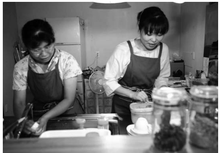
「ほわぼわ」は、子育て中のお母さんたちがスタッフとして活動しているカフェです!