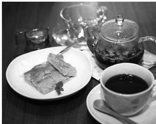
妊娠中のママや乳幼児がいるママにも楽しんでもらえるようなノンカフェインのメニューも用意。もちろん、手作りのお菓子(飲み物とセットで300円)も要チェックです!(この日はりんごのソフトクッキー)