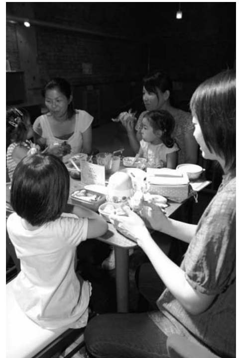
大人は1人1品の飲み物の注文をお願いしています。その代わりに、メニューにない食べ物や飲み物の持ち込みは自由! なお、ごみは各自持ち帰りをお願いします。