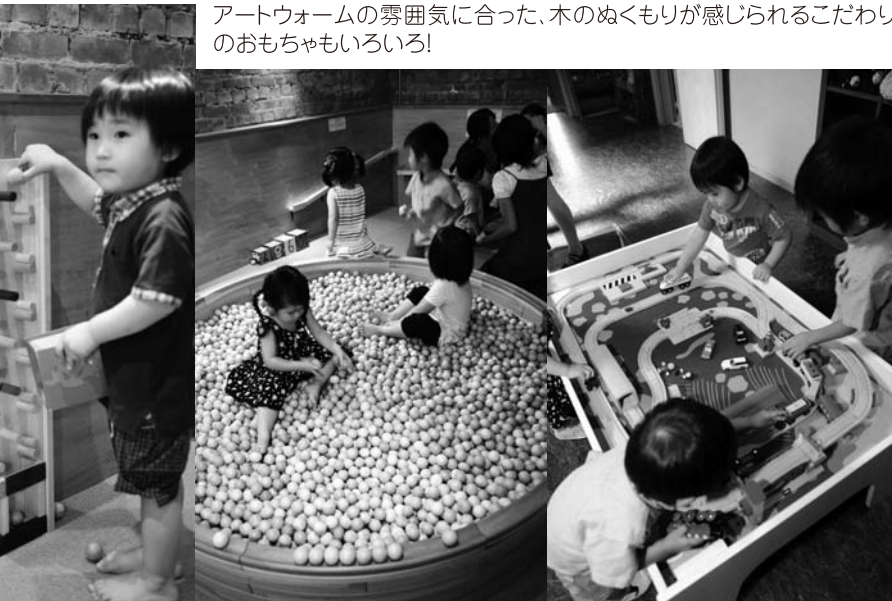
アートウォームの雰囲気に合った、木のぬくもりが感じられるこだわりのおもちゃもいろいろ!