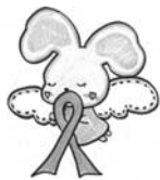
マスコット めみちゃん