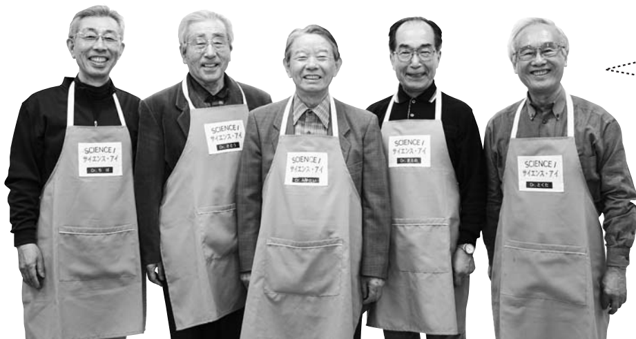
石狩の科学者グループ「サイエンスアイ」の皆さん

月に1度、土曜の午後に図書館の研修室で「サイエンスプラザ石狩」を開催しています。小学1年生以上が対象で、いつもにぎやかな雰囲気の中で実験を楽しんでもらっています。中には毎月足を運んでくれる親子もいるんですよ。子どもたちに理科の面白さを少しでも肌で感じてもらえたらうれしいですね。次回は6月12日(土)に「水に浮く力をはかる」というテーマで開催します。