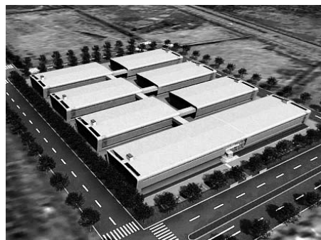
さくらインターネット石狩データセンター完成予想図。

今後、石狩湾新港地域に情報通信関連産業が集積することで、石狩が世界のネットワークの中継拠点として位置付けられる可能性が広がります。世界から一目置かれる「石狩」。そんな日が一日も早く訪れるよう、市ではさらに全力で誘致活動に取り組んでいきます。