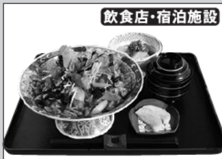
飲食店・宿泊施設