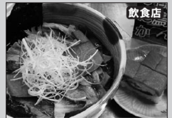
▲「オリジナル鮭醤油ラーメン」