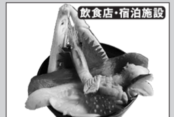
飲食店・宿泊施設