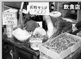
▲石狩産農水産物はほぼ全種類 取り扱っています