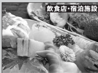
飲食店・宿泊施設