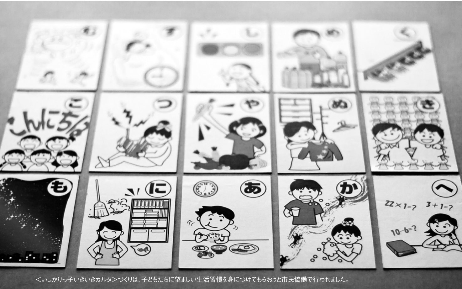
くいきりっ子いききカルタづくりは、子どもたちに望ましい生活習慣を身につけてもらおうと市民協働で行われました。