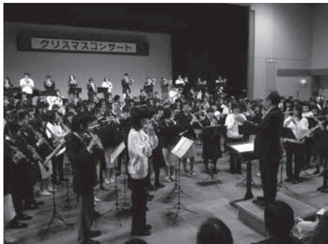
コンサート終盤の総勢約200人による合同演奏。学校や学年の垣根を越えて心を一にして演奏する姿に、会場から盛大な拍手が起こりました。

12月11日(土)、花川北コミセンで恒例の「クリスマスコンサート2010」が開催されました。出演したのは市内約230人の児童・生徒で、石狩エンジェル・クリア少年少女合唱団、南線小学校リコーダークラブ、市内中学校4校・高校2校の吹奏楽部のメンバー。各種コンクールなどで高い評価を得ている実力派ぞろいということもあり、聴きにきた男性客は「すごい迫力でびっくり」と話していました。