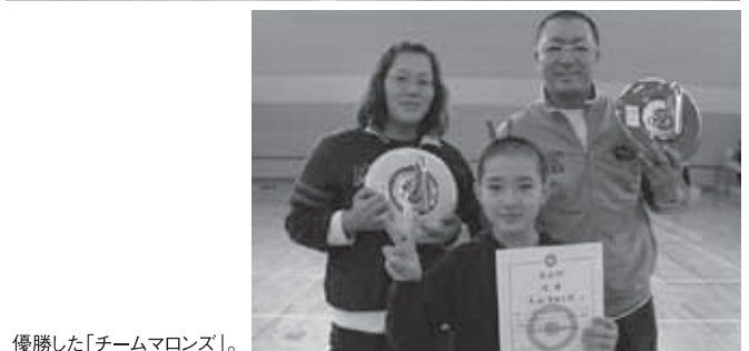
優勝した「チームマロンズ」。