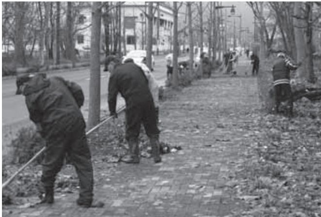
この清掃活動は平成18年度から毎年実施されています。

11月12日(金)、(社)石狩市シルバー人材センターが、花川南・花川北防風林周辺の市道の落ち葉を清掃するボランティア活動を行いました。当日は同センターの会員のほか、「NPO法人明るい社会づくり運動石狩明社の会」の方々も参加して、道路いっばいに広がった落ち葉を慣れた手つきで集めていました。