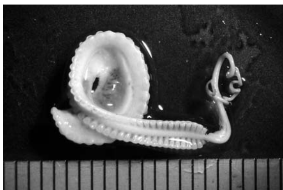
◀交接腕には2列の吸盤が無数にあるのが分かります。目盛りは1mm。

と呼ばれるもので、自分の精子をメスの体内に送り込むための特殊な腕なのです。「交接」の際、この腕はオスから切り離され、しばらくメスの体や殻の中に潜んで受精の時を待つと考えられています(詳しいことはまだ明らかにされていません)。 今回のこの交接腕の発見は、石狩はもちろん、北海道でも初めての記録です。2010年に採集された大量のアオイガイや中身のタコとともに、4月末より資料館のテーマ展で公開します！