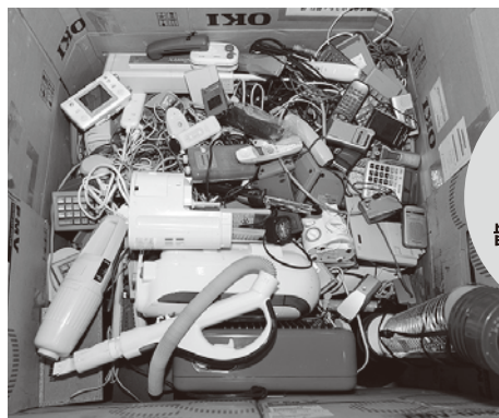
◀小型電子・電気機器回収ボックスの中

OA機器のプラスチック部分は細かく碎き、紙や木くずと一緒にして固形燃料に。製紙工場などで使われているそう。