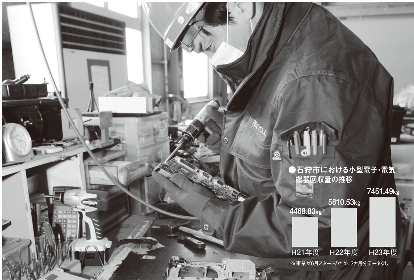
●石狩市における小型電子・電気機器回収量の推移