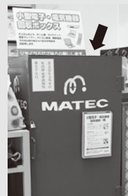
小型電子・電気機器回収ボックス

そのほかの回収品目：デジタルカメラ・ビデオカメラ・DVDデッキ・ノートパソコン・ゲーム機・携帯電話・携帯音楽プレーヤー（CD、MD、MP3、iPodなど）・電話機・ファクシミリ・ワープロ・電子手帳・電子辞書・電卓・CDドライブ・DVDドライブ・無線LAN・電話端末（モデムなど）・パソコン部品・パソコン周辺機器・カードリーダー・カーナビ・カーテレビ・カーオーディオ・ETC・GPS関係装置・トランシーバー・小型液晶テレビ（携帯型）・チューナー（デジタル、CATV）・充電器・電源ケーブル・接続コード・ゲームソフト・小型ヘッドホン・イヤホン・各種メモリー（USB、コンパクトフラッシュ、スマートメディア、メモリースティック、マルチメディアカード）・LANケーブル