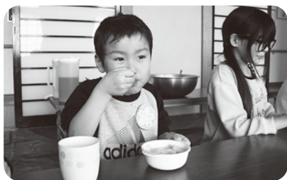
1年生歓迎会での白玉だんご作り