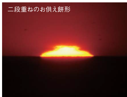
二段重ねのお供え餅形