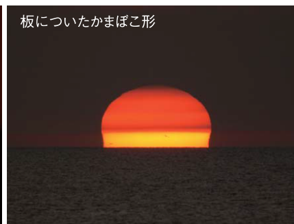
板についたかまぼこ形