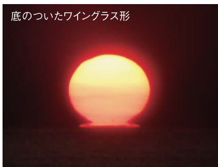
底のついたワイングラス形